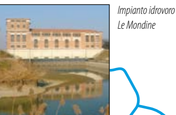
Impianto idrovo Le Mondine

La presenza di una tale ricchezza naturalistica in un contesto fortemente caratterizzato dalla presenza dell'uomo, non potrà che sorprendere il visitatore e far riflettere sulla possibilità di coniugare l'agricoltura di qualità con la qualità ambientale.