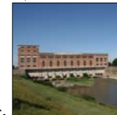
Impianto idrovo S. Siro

Al termine di un faticoso percorso di candidatura durato oltre un anno, nel 2008 il SiPOM ha ricevuto da EUROPARC Federation (l'associazione che raccoglie oltre 400 aree protette di 35 paesi europei) l'importante riconoscimento della Carta Europea del Turismo Sostenibile. La Carta, che rappresenta il riferimento obbligatorio della politica turistica delle aree protette dell'Unione Europea, premia quelle realtà che, attraverso un attento percorso di indagine tecnica e di partecipazione delle popolazioni locali, definiscono una strategia di sviluppo turistico che "soddisfi le esigenze attuali dei turisti e delle regioni di accoglienza, tutelando nel contempo e migliorando le prospettive per il futuro, integrando la gestione di tutte le risorse in modo tale che le esigenze economiche, sociali ed estetiche possano essere soddisfatte, mantenendo allo stesso tempo l'integrità culturale, i processi ecologici essenziali, la diversità biologica e i sistemi viventi".